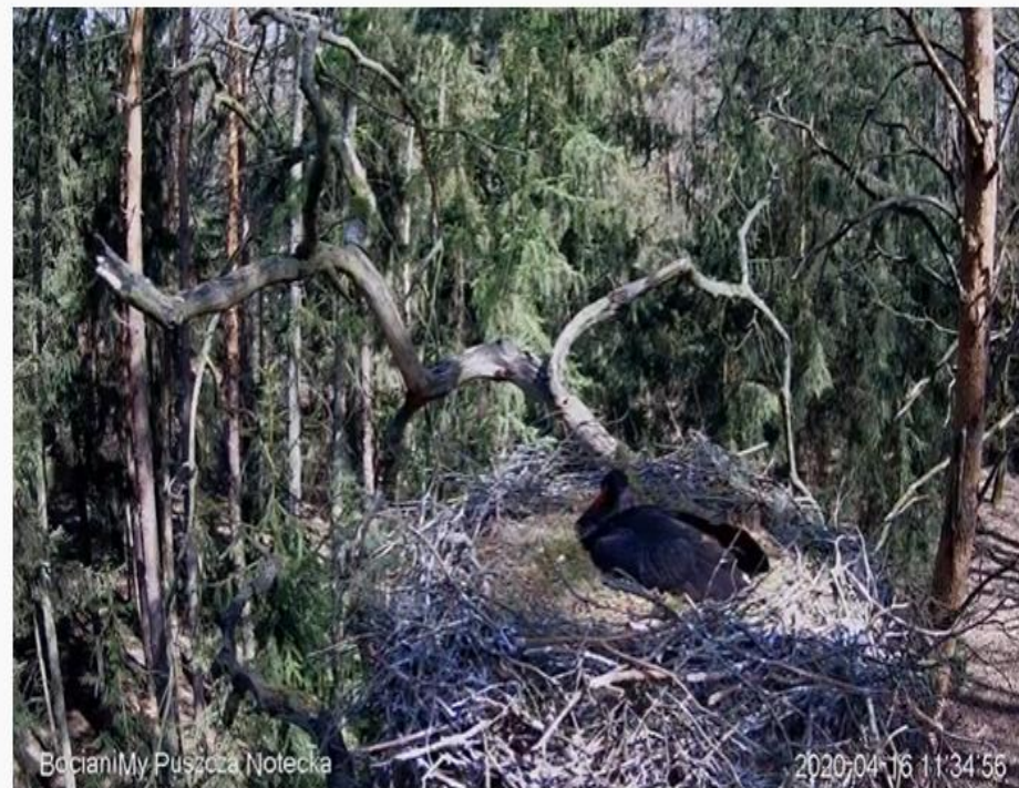
Bocian czarny Online Puszcza Notecka / Black stork Online Notecka Forest

https://www.youtube.com/watch?v=iKUyr5dG39A&feature=share&fbclid=IwAR3AeACrWplR7Eus56lRgOxSj2e321iV62iTOgiaZs9hrTGJisFl2R4mB-l