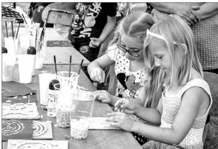
Deti si mohli vytobiť vlastný modrotlačový formu a látku