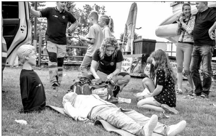
Deti sa mohli stretnúť aj s profesionálnymi záchranármi