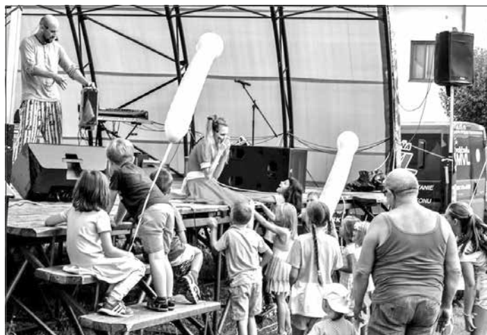
Dorotka z Fidorkova zabávala deti