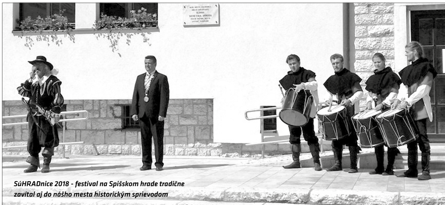
SÚHRADNICE 2018 - festival na Spišskom hrade tradične zavítal aj do nášho mesta historickým sprievodom