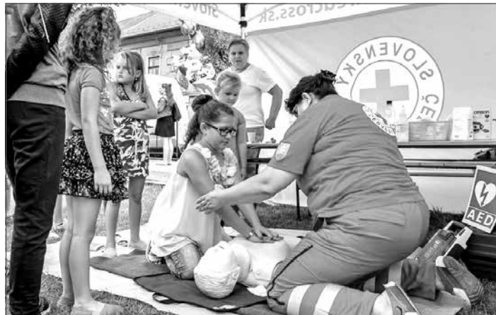
Stanovišťa Červeného kríža